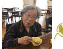
おやつレク あんみつ作り