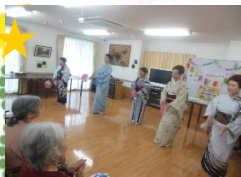
演芸披露 南・友の会

10月は運動会があります。楽しい競技を計画していますので、是非応援にいらして下さい。もちろん飛び入りも大歓迎！ 外出行事も大勢の方が楽しく過ごして頂けるように計画しています。 外でのお食事は気分も変わるのか、食欲も出て箸がすすみます。