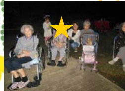
秦野 たばこ祭り 花火観賞