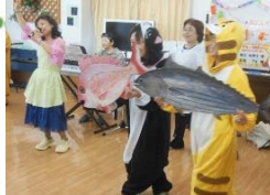
演奏会 ラ・ポール