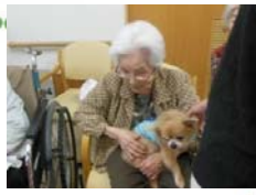
ドッグセラピー 犬猫笑顔の会