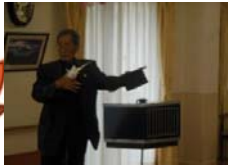
マジックショー 秦野マジッククラブ