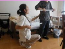
立位バランス訓練